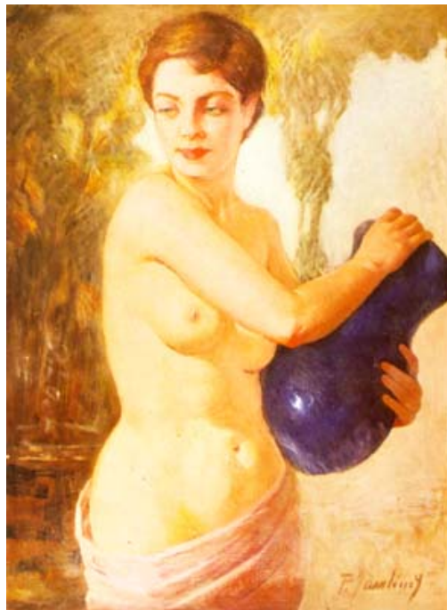
"Jarrón azul" Pascual Gambino Óleo sobre tela