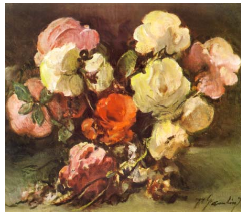
"Rosas" Pascual Gambino Óleo sobre tela