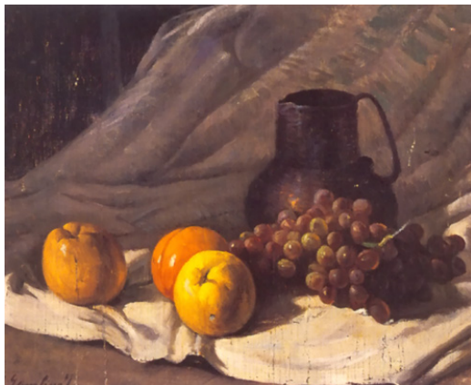
"Bodegón" Pascual Gambino Óleo sobre tela