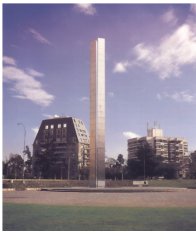
Monumento al General René Schneider. 1971 Acero Rotonda Kennedy - Santiago