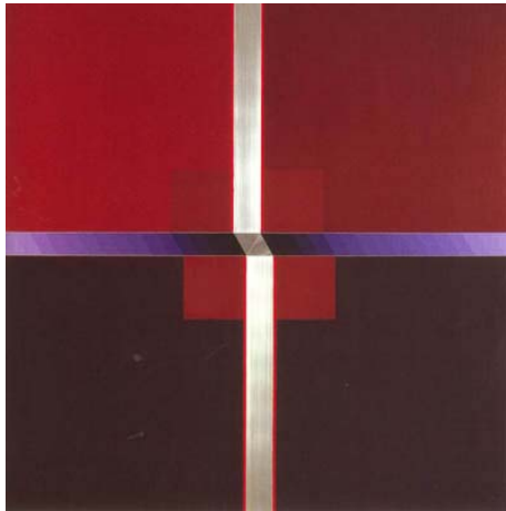
Sin título 1979 Mixta Museo de Artes Visuales - Santiago