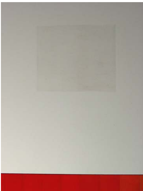
TESTIGO DE LIMPIEZA