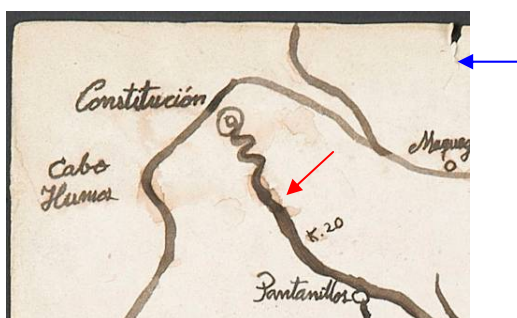
Figura 3: Corrimiento de tinta y rasgado. (V. Rivas, 2009)