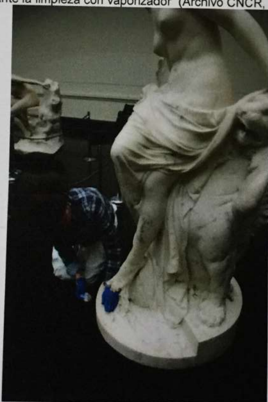
Limpieza de base con solvente