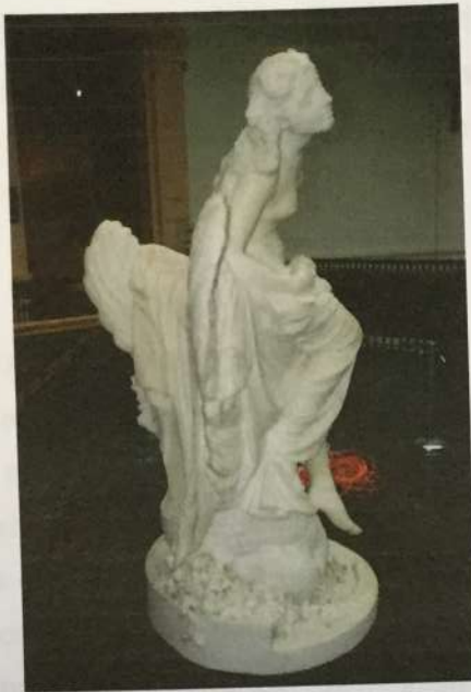
Vista lateral derecha