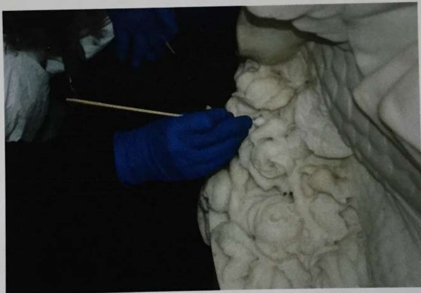
Limpieza puntual con hisopo