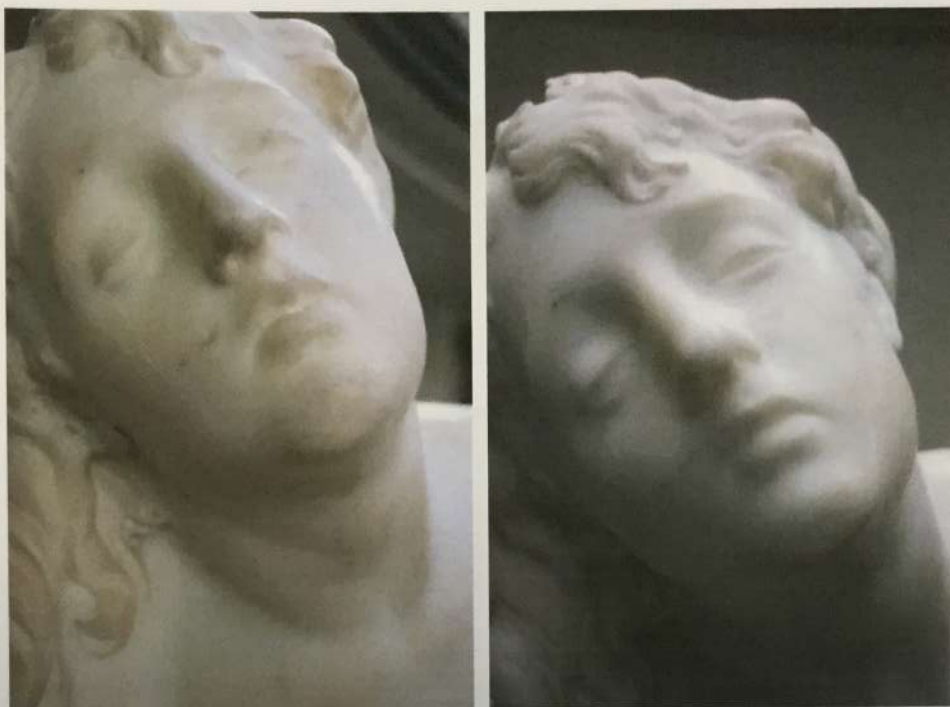
Detalle de antes y después de la limpieza