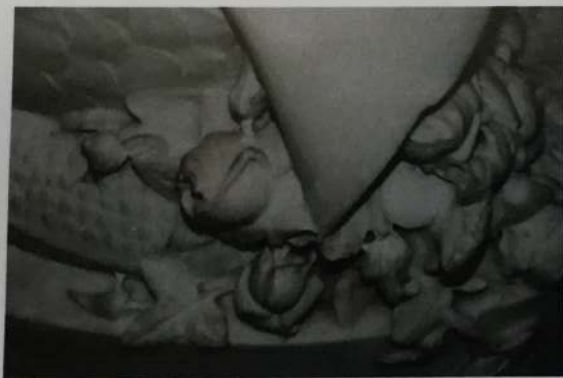
Detalle de suciedad acumulada

Bueno. Solo presenta suciedad superficial generalizada y exceso de acumulación de polvo en los intersticios de la decoración.