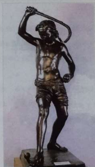
El jugador de chueca (1880) SURDOC Museo Nacional de Bellas Artes