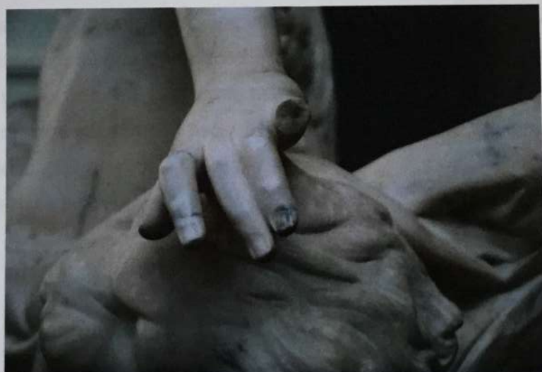
Dedo faltante de mano izquierda. (Costabal. I, 2012)