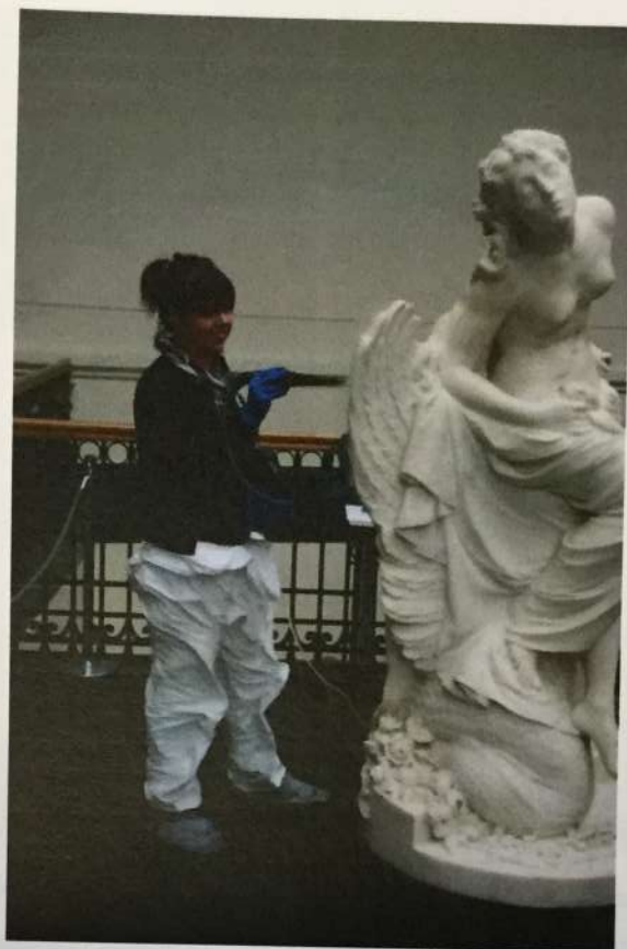
Durante la limpieza con vaporizador