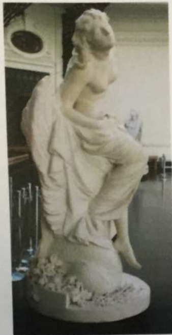
Vista lateral derecha