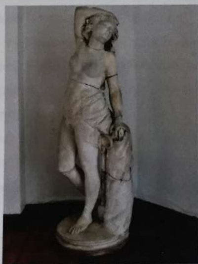
La bacante (1874) SURDOC Museo Benjamín Vicuña Mackenna

Entre sus obras encontramos “el jugador de chueca”, “La bacante”, “prologo y epilogo”, entre otras. (cfr. Carvacho, [1983]:187)