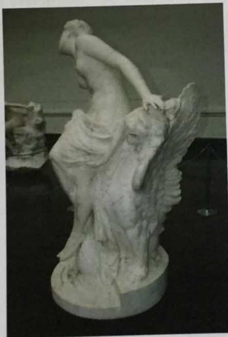
Vista lateral derecha