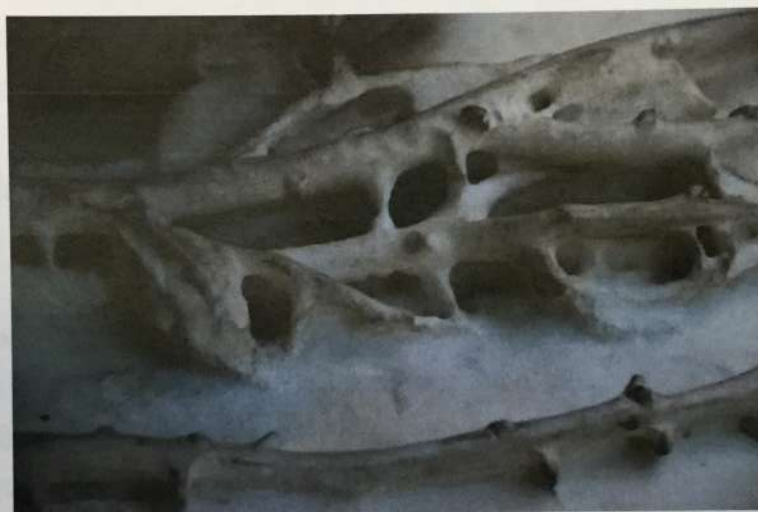
Suciedad acumulada en la superficie e interiores de la decoración floral.

Estructuralmente no presenta daños mayores, salvo la pérdida de un dedo meñique de la mano izquierda.