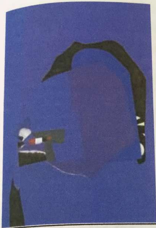
¿A dónde se fueron los pájaros? Acrílico/tela 188 x 128 cms. Año 2000