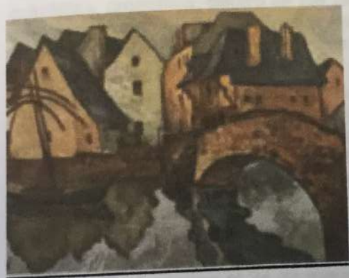
Marco Bontá Dinan II, Bretaña 1929 Aguatinta / papel Col. Particular