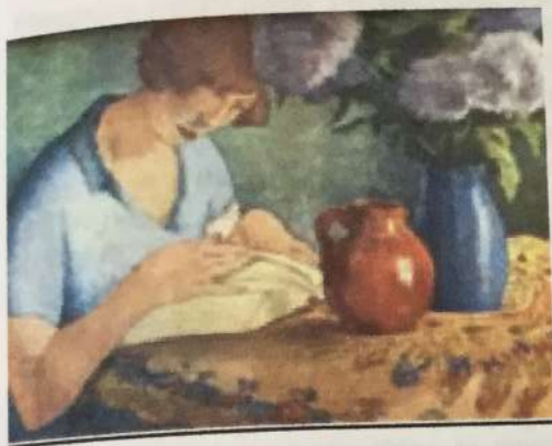
Marco Bontá "La lectura" Aguatinta / papel