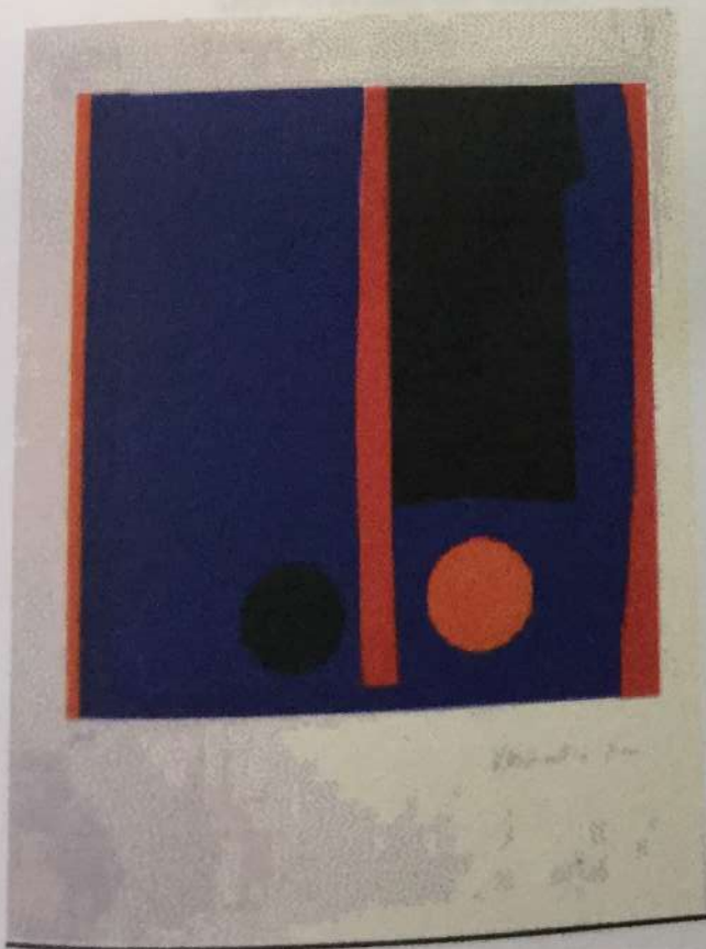
Serigrafía II Grabado/serigrafía 75 x 55 cms. Año 1972