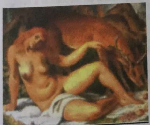
Marco Bontá Diana 1929 Óleo / tela Museo Nacional de Bellas Artes