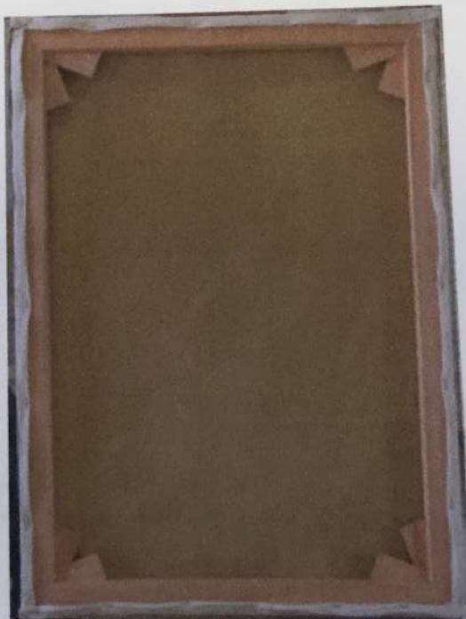
Anverso y reverso de la obra al inicio y finalizada la restauración.