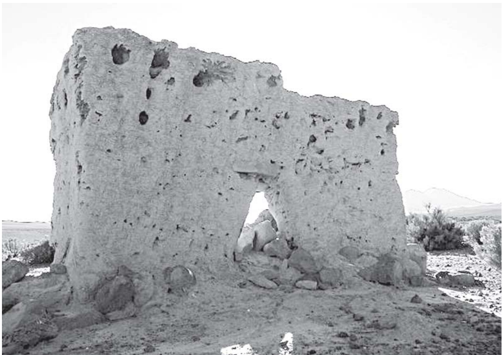
Figura 6. Chullpa del altiplano de Tarapacá (Citani, Isluga).