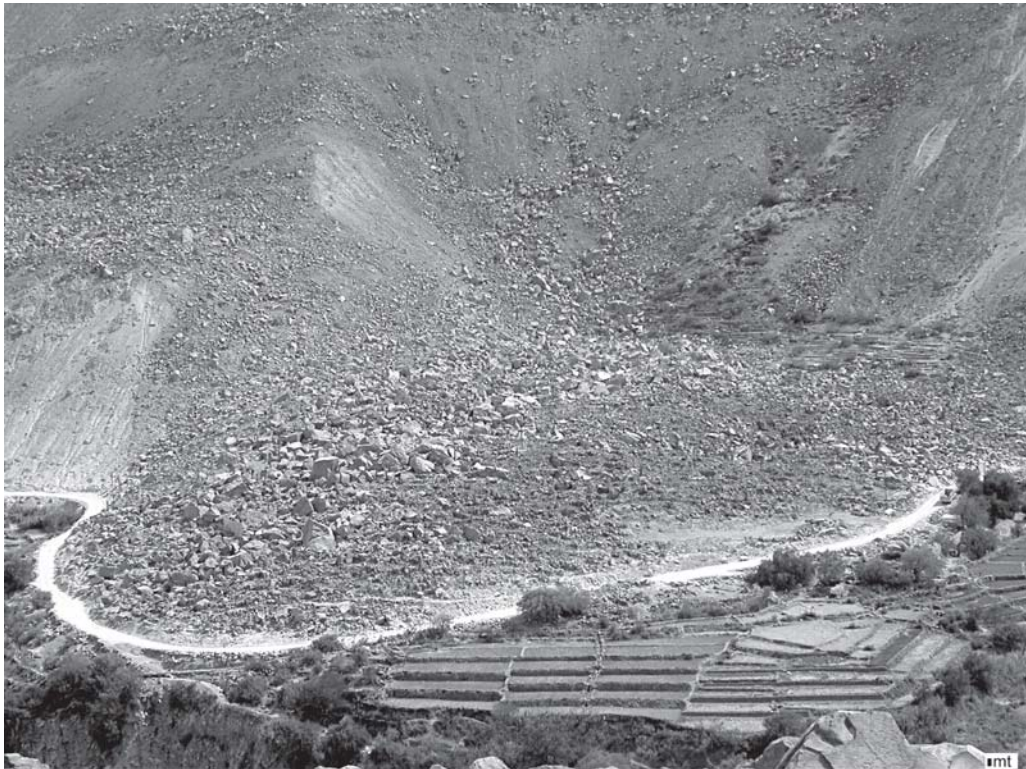
Figura 4. Vista de Camiña-1 en el ámbito de la sierra de Tarapacá.