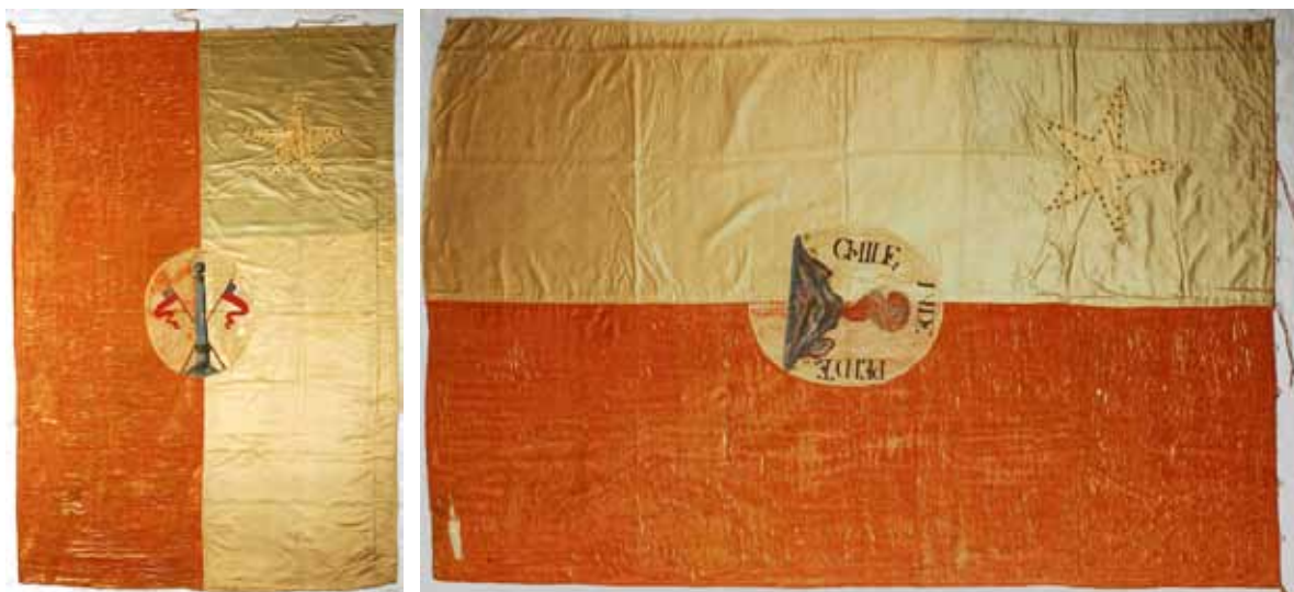
Foto 1. Faz A y Faz B, antes de la restauración.