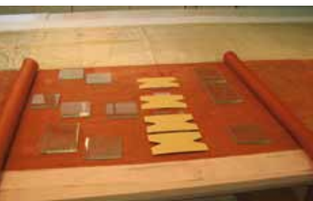
Foto 15. Aplicación de crepelina sobre el campo rojo.

Debido a la pérdida de urdimbre en el campo rojo, los hilos de trama al estar destejidos quedaron más largos que el ancho del campo, por lo que al ordenarlos presentaban cierta ondulación que se debió mantener para evitar una mayor deformación. Una vez ordenados los hilos sobre la tela de soporte, todo el campo se cubrió con una crepelina de seda teñida en el color del original. Esto se hizo con el fin de aplicar a todo el campo una cubierta protectora que evitara que los hilos se engancharan con la manipulación y que, por otra parte, no interfiriera visualmente con el original. La crepelina se fijó con hilo de seda del mismo color mediante puntadas equidistantes utilizando patrones de 10 cm x 5 cm. El original quedó encapsulado entre la tela de soporte y la crepelina.