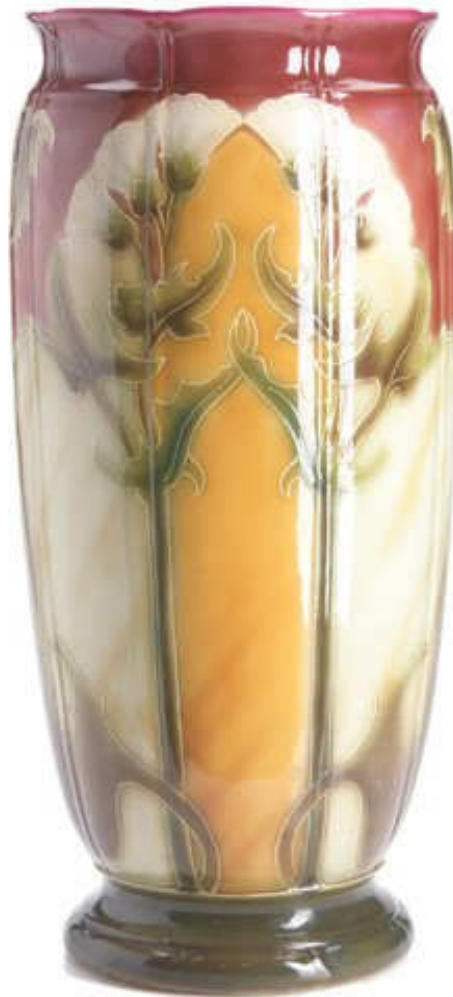
Imagen 5: Paragüero alemán de estilo Art Nouveau, fabricado por Royal Bonn, ca.1900.