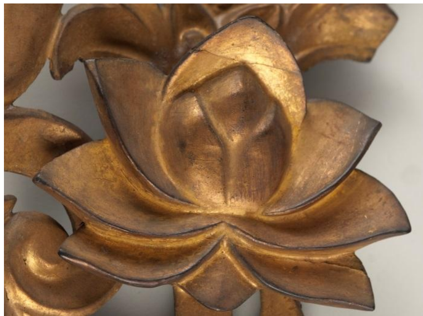
Imagen 6: Detalle de la corona, flor de loto y llama