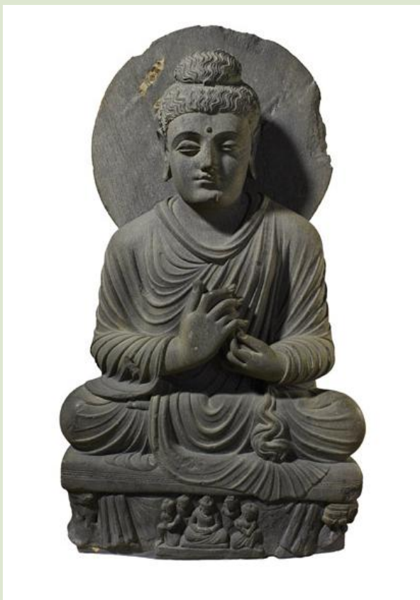
Anónimo Buda sentado de Gandhâra Pakistán, ca. siglo II-III d.C. Piedra tallada 95 x 53 x 24 cm. Museo Británico, Londres