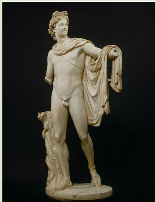
Anónimo Apolo Belvedere Reproducción. Ca.130-140 D.C. Escultura en mármol 224 cm. Museo Pio-Clementino Ciudad del Vaticano.