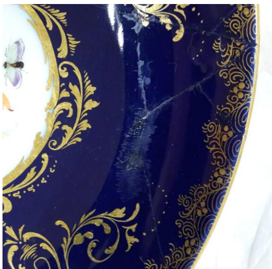
Reintegración cromática inadecuada.