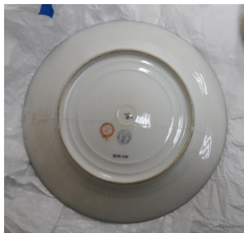
Vista posterior, detalle reintegración cromática