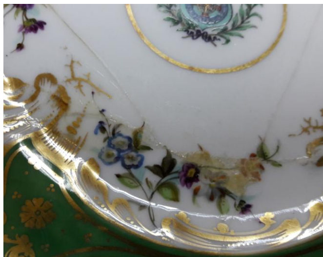
Reintegración cromática inadecuada y amarillamiento de la capa de protección.