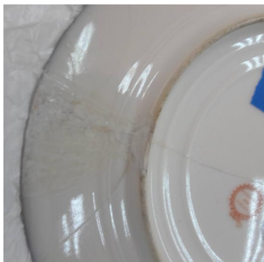
Reintegro cromático inadecuado y amarillamiento de la capa de protección.