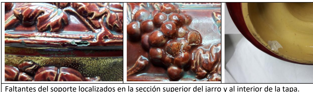
Faltantes del soporte localizados en la sección superior del jarro y al interior de la tapa.