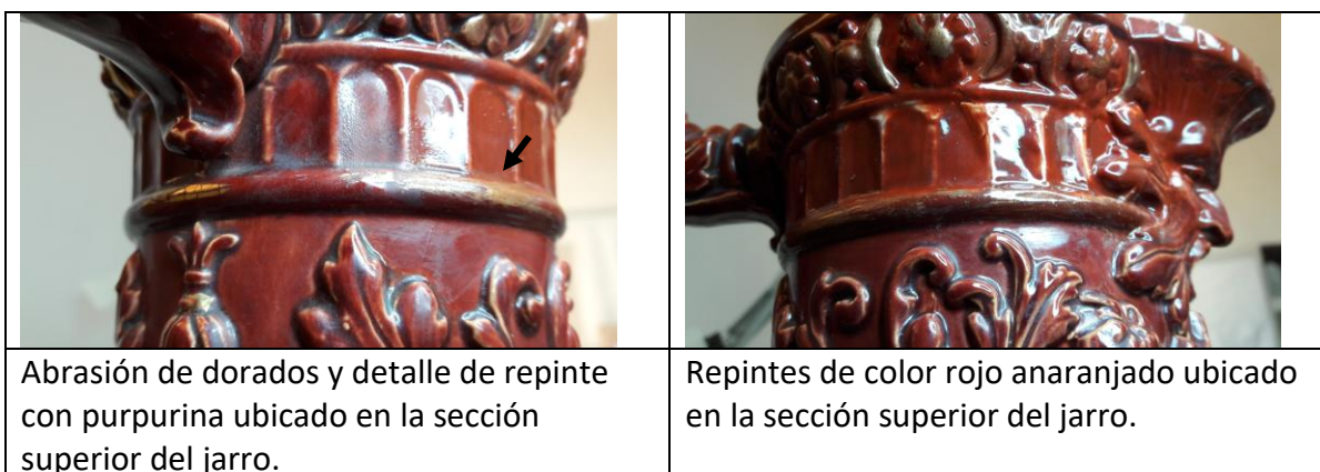
Abrasión de dorados y detalle de repinte con purpurina ubicado en la sección superior del jarro.