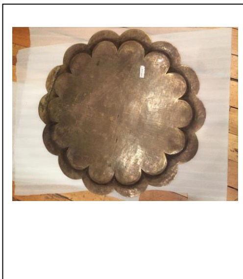
Reverso / detalle