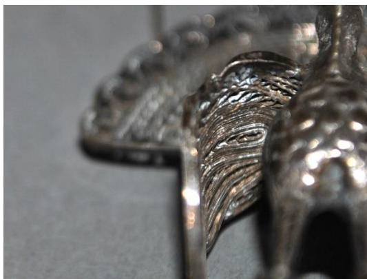
Estado inicial, detalle: restos de productos de limpieza