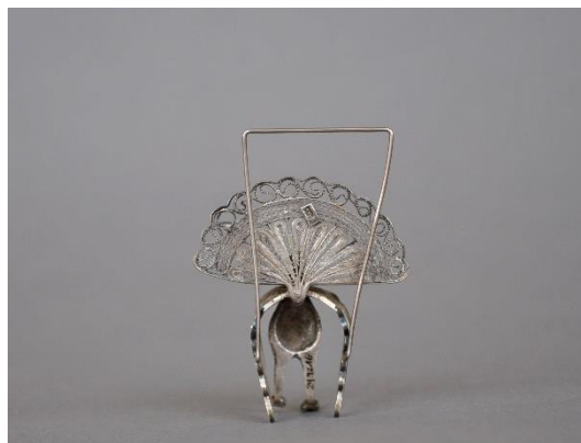
Estado inicial, vista posterior