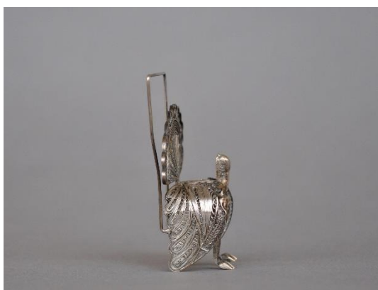
Estado inicial, lateral derecho