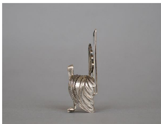
Estado inicial, lateral izquierdo