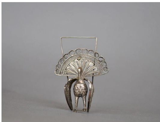
Estado inicial, vista frontal