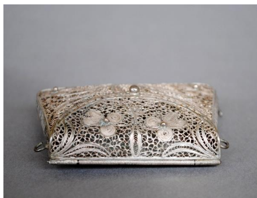
Estado inicial, vista superior