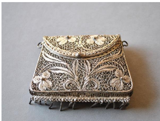
Estado inicial, vista frontal