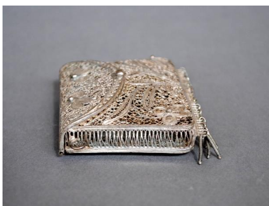
Estado inicial, lateral derecho