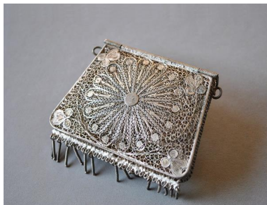
Estado inicial, vista posterior