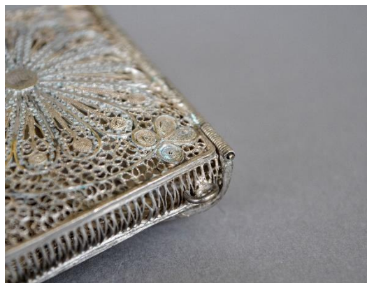
Estado inicial: detalle corrosión verdosa