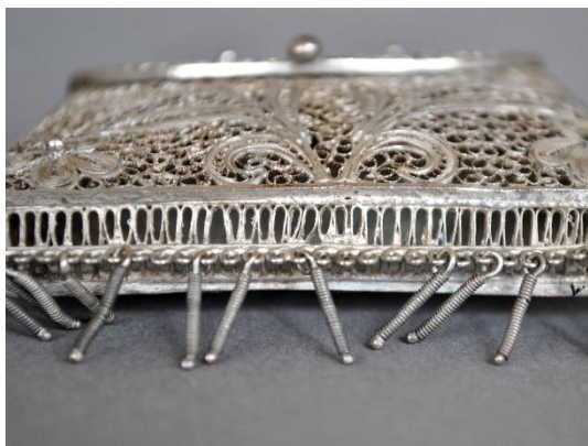
Estado inicial detalle con faltantes