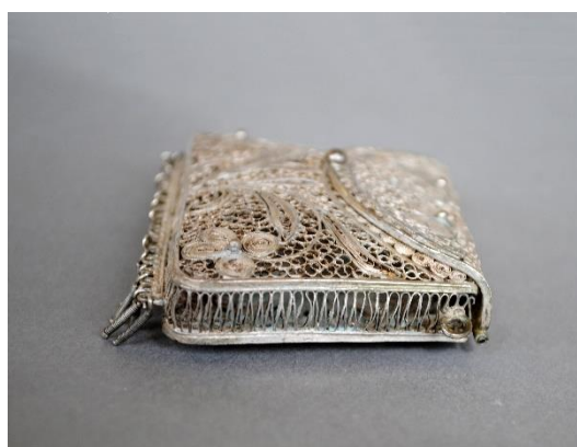
Estado inicial, lateral izquierdo