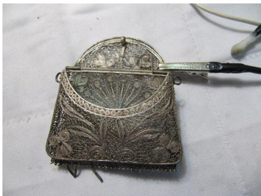
Durante la limpieza electroquímica