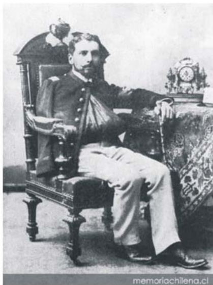
Fotografía de Luis Orrego Luco, después de la guerra.

Previo al estallido de la Revolución de 1891, la Junta de Gobierno le había ofrecido el cargo de Sub-Secretario de Relaciones Exteriores el cual rechazó. Se une en Iquique a las fuerzas congresistas donde tuvo una activa participación combatiendo contra el gobierno del presidente Balmaceda. Prontamente logra el grado de mayor del regimiento Chañaral 5° de Línea. Combatiendo en Concón es herido de bala en su brazo derecho. Esta experiencia, el cronista lo retrata en el cuento “Sensaciones de Batalla” en 1891, como parte de la colección “Paginas Americanas”, publicado en 1892.