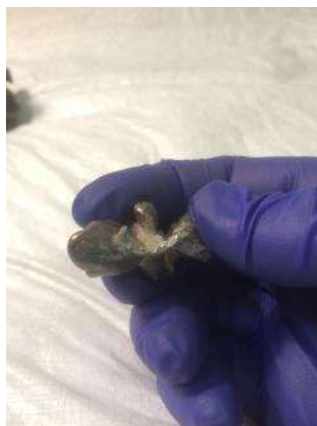
Detalle superficie elemento desprendido.