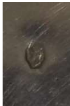
Sello plata auténtica 925, origen Francia.