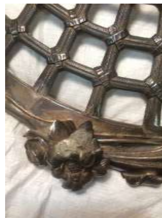
Detalle sector de ensamble.