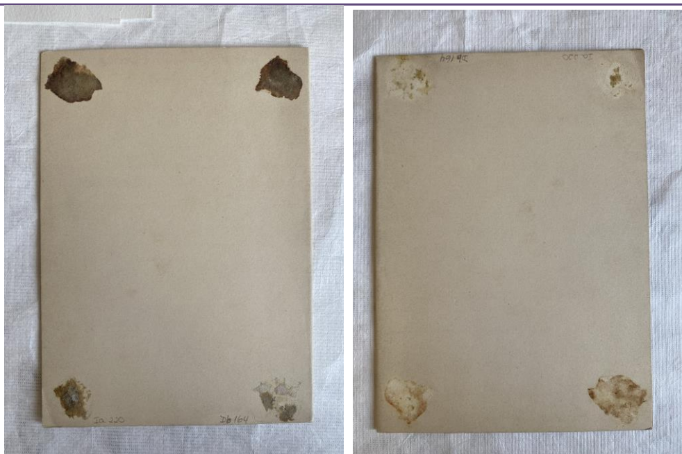
Antes y después del tratamiento de limpieza y remoción de papel adherido oxidado.

Manipulación: Evitar el contacto directo con las manos, utilizar guantes de algodón para su manipulación y mantener en el sobre en el caso de manipulación. Dado que el papel es catalogado con sensibilidad media 1 , se recomienda un nivel máximo de luz visible (lux) de 50, con un máximo de 150.000 lux h/a.